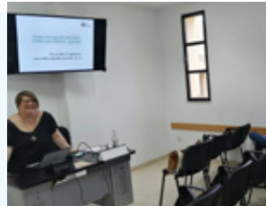
Αναπληρώτρια Καθηγήτρια στο ΜΠΣ «Ελληνική Γλώσσα και Λογοτεχνία»

Ακαδημαϊκό έτος κινητικότητας: 2018-2019