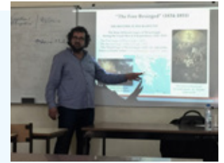
Διδάσκων στο ΠΠΣ «Σπουδές στον Ελληνικό Πολιτισμό»

Ακαδημαϊκό έτος κινητικότητας: 2019-2020