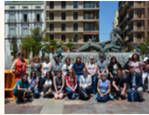
Students and Programmes of Study Support Unit

My participation in the International Staff Training Week, organised by the Universitat Politècnica de València, was an unforgettable experience! During my stay, I had the opportunity to visit and learn about the work of the various departments of the University that participated and held presentations at the Staff Week, including the Alumni Office and its different activities. The ideas that I gathered are extremely useful for the newly established Alumni Office of OUC and its strategy, as they can enrich the range of activities that our own Office may envisage in the near future. Finally, the cultural and social events organised by the University gave us a glimpse into the history, culture and civilisation of Valencia, allowing us to get to know each other better and strengthen the bonds amongst the 'team'