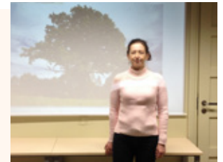
Διδάσκουσα στο ΠΠΣ «Σπουδές στον Ελληνικό Πολιτισμό»

Ακαδημαϊκό έτος κινητικότητας: 2019-2020