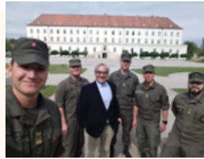
Καθηγητής στο ΜΠΣ «Επιστήμες της Αγωγής»

Ακαδημαϊκό έτος κινητικότητας: 2018-2019