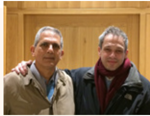
Καθηγητής στο ΠΠΣ «Σπουδές στον Ελληνικό Πολιτισμό»

Αντίθετα, το Τμήμα Μεσαιωνικών Σπουδών του Central European University που προσφέρει μεταπτυχιακά προγράμματα σε θεματικές σχετικές με τις βυζαντινές σπουδές, κάτι σπάνιο αν όχι μοναδικό, έχει πλέον καθιερωθεί ως σημαντικό κέντρο των σχετικών σπουδών. Οι υποτροφίες που προσφέρει το εν λόγω Πανεπιστήμιο το έχουν αναδείξει σε σημαντικό πόλο έλξης υποψηφίων φοιτητών από την Ευρώπη, την Ασία και την Αμερική και η ευρύτητα των αντικειμένων που διδάσκονται εκεί είναι μια άλλη παράμετρος που βαρύνει στην επιλογή τους αυτή. Οι σχέσεις μου με το Τμήμα αυτό