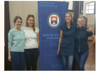
Accounting Department, Finance and Human Resources Unit

My participation in the Erasmus+ Programme as Administrative Staff at the University of Belgrade in Serbia was a unique experience that I would recommend to everyone. It allowed me to improve my knowledge of English as well as my social and cultural skills, whilst enhancing my professional development and helping me acquire abilities and skills through contacts with new experienced colleagues. It has also broadened my professional and personal network. Finally, I had the chance to visit some of the sights of Serbia and was very impressed with how green the country is and the hospitality of its people. Participating in Erasmus+ is a once in a lifetime experience not to be missed by anyone who is given this opportunity!