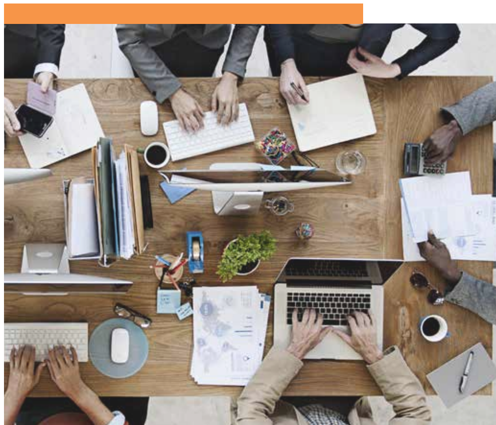
Οι εμπειρογνώμονες του ΑΠΚΥ